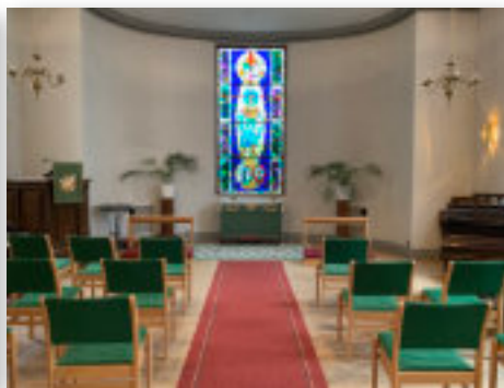
S:t Jakobs Kyrka, Göteborg