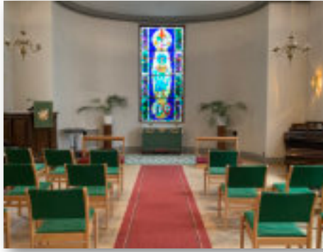
S:t Jakobs Kyrka, Göteborg