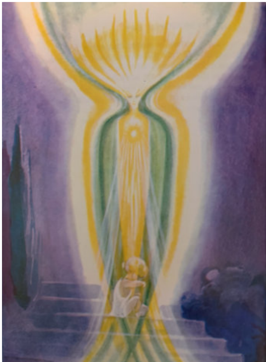
EN HEALING ANGEL. FRÅN GEOFFREY HODSONS BOK: THE KINGDOM OF THE GODS.